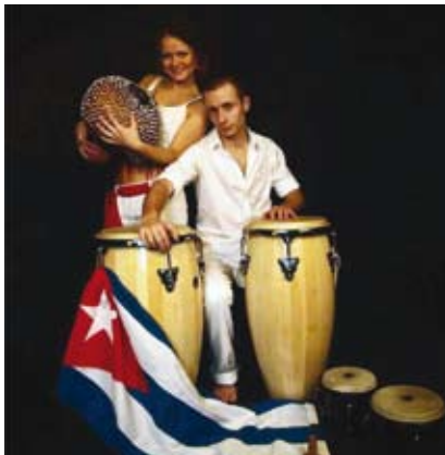
Salsoteki odbywają się co dwa tygodnie we wtorki.

Od paru lat w Hotelu Liburnia co dwa tygodnie we wtorki odbywają się bezpłatne Salsoteki prowadzone przez instruktorów Centrum Ruchu i Tańca Impulso.