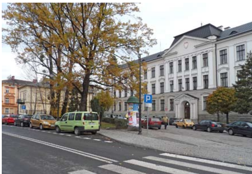
Nowym systemem opłat zostaną objęte miejsca postojowe na placu Słowackiego (przed I Liceum im. A. Osuchowskiego), powiększonym o łącznik między ulicami Pokoju i 3 Maja.