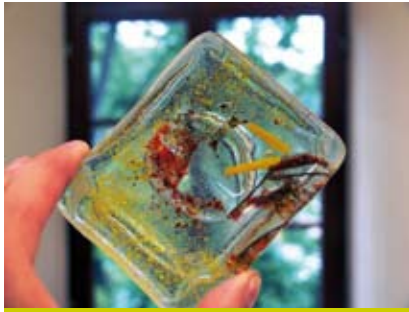
Wykonania takich cudniek uczą warsztaty fusingu.

Przepiękna biżuteria, unikatowe elementy dekoracyjne czy też części wyposażenia wnętrz – wszystko to można stworzyć za pomocą techniki fusingu, czyli stapiania szkła, której można się nauczyć w Zamku Cieszyn.