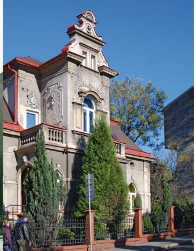
Budynek Przedszkola nr 1 na ul. Michejdy w roku 1983 i 2012.