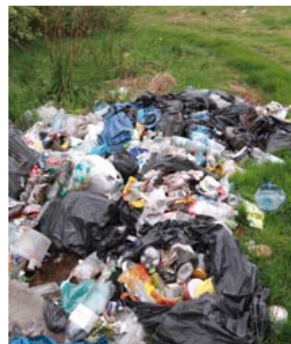
Nowy system odbierania odpadów komunalnych przyczyni się do likwidowania problemu dzikich wysypisk.

Aby nowy system odbierania odpadów komunalnych mógł funkcjonować, powyższe uchwały muszą zostać podjęte do końca 2012 r. Jest to efekt wejścia w życie nowelizacji ustawy o utrzymaniu czystości i porządku w gminach, która zobowiązuje wszystkie gminy do uruchomienia tego systemu najpóźniej 1 lipca 2013 r. Niestety, ustawa ta jest w wielu miejscach niejednoznaczna i