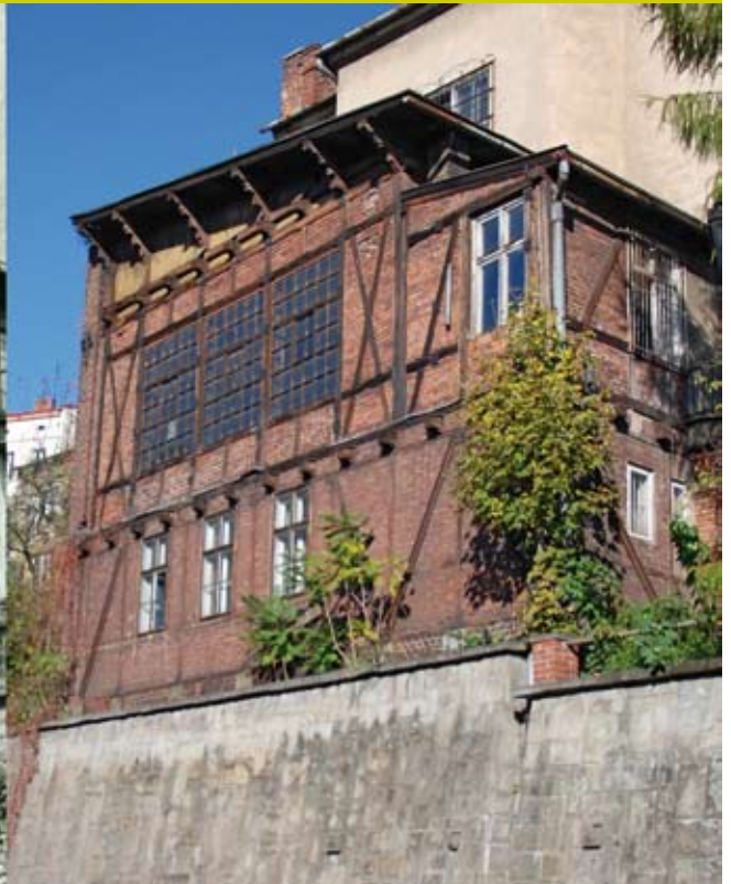
Na Cieszyńskiej Wenecji, w roku 1983 i 2012.

Zapraszamy Czytelników do współredagowania tej kolumny. Prosimy o nadsyłanie ciekawostek związanych z Cieszynem (np. anegdot, przepisów kulinarnych, zdjęć, dokumentów, wzorów rękodzieła artystycznego itp.), które mogłyby zainteresować innych i wzbogacić wiedzę o naszym mieście. Gwarantujemy zwrot wszystkich otrzymanych materiałów.