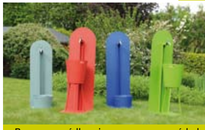
Prace w ogródku nie muszą oznaczać bólowych pleców.

Już w 2050 roku połowa Europejczyków będzie w wieku emerytalnym i będzie potrzebowała mądrze zaprojektowanej przestrzeni, a także stworzonych z myślą o nich produktów i usług. ▶ 6