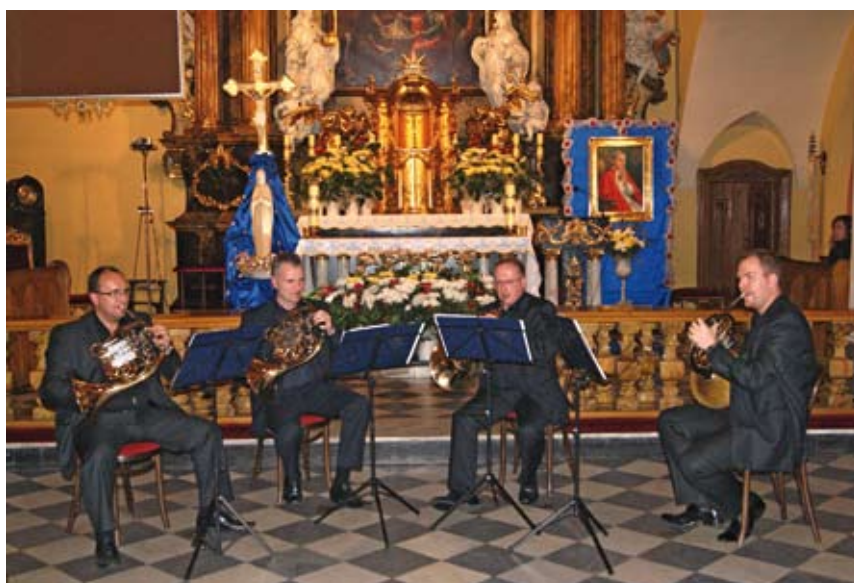
Koncert Śląskiego Kwartetu Waltorniowego.

Organizatorzy: Cieszyński Ośrodek Kultury „Dom Narodowy” i KaSS „Střelnice” w Czeskim Cieszynie serdecznie dziękują kościołom i parafiom za życzliwą współpracę i pomoc organizacyjną w przygotowaniu imprezy. COK