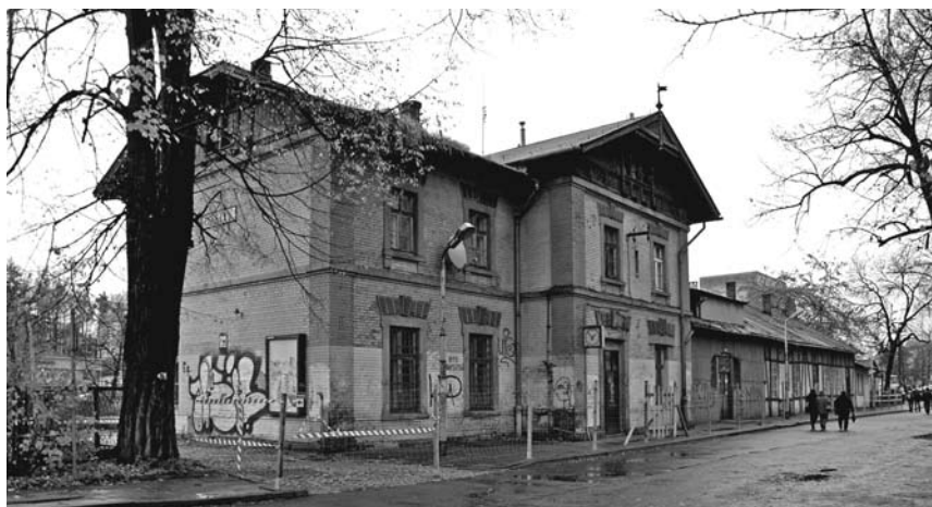
Obok budynku dworca PKP na placu Hajduka staną toalety dla podróżnych.

W ostatnim czasie inwestor przygotowując się do rozpoczęcia budowy, zamknął toalety usytuowane