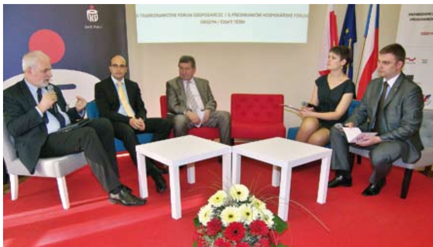
Przedsiębiorcy, samorządowcy i politycy spotkali się na Transgranicznym Forum Gospodarczym by rozmawiać o sytuacji firm z Polski i Republiki Czeskiej w kontekście kryzysu.