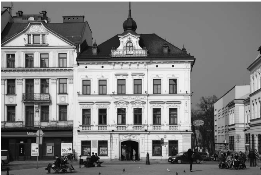
Nowego dyrektora Cieszyńskiego Ośrodka Kultury wybierze powołana przez Burmistrza komisja konkursowa.