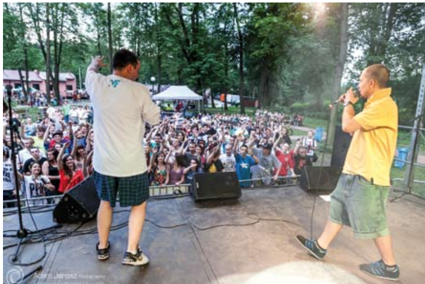
Tak bawili się cieszynianie na imprezach organizowanych w Parku pod Wałką.

Przez całe lato, jeśli tylko pozwalała na to pogoda, można było spędzić czas na piaszczystej plaży na Campingu Olza. Było to doskonałe miejsce, by czując piasek pod stopami, zażywać kąpieli