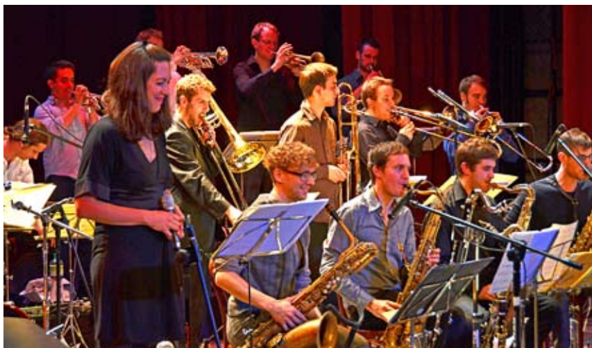
Lucerne Jazz Orchestra ze Szwajcarii zagrała w cieszyńskim teatrze.